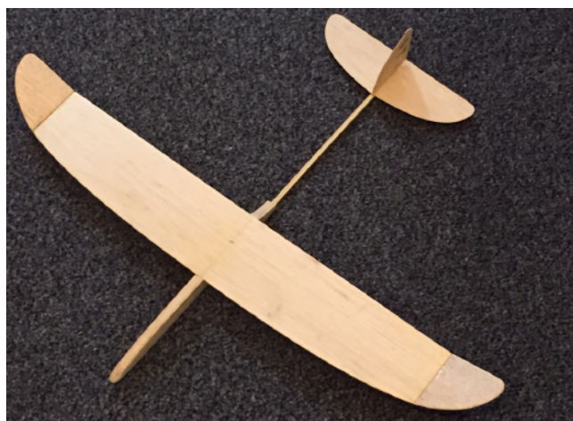
Kursmodell „Quicker“ Bauzeit ca. 4 h

Depron-Nurflügel. Geeignet für Anlässe. Prima Flugeigenschaften